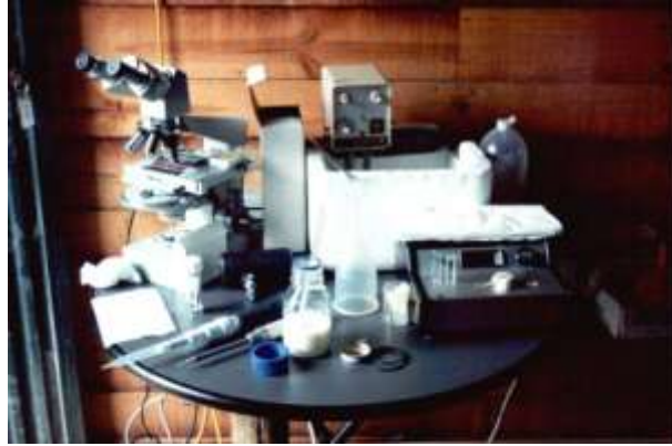
Figura 6. Material de campo para avaliação e refrigeração do sémen.