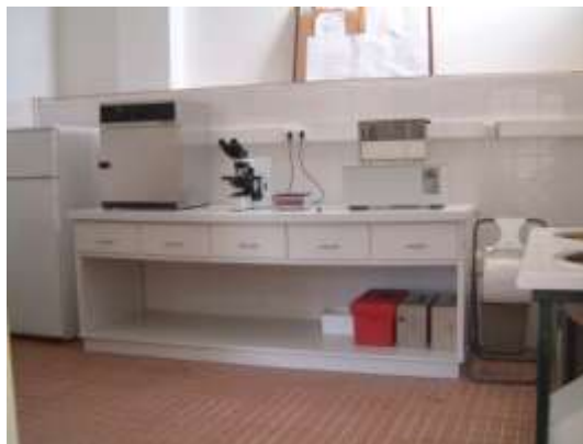
Figura 7. Laboratório de avaliação e refrigeração de sémen.