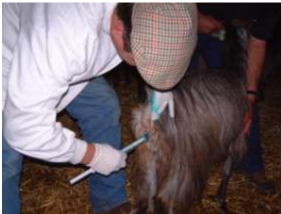
Figura 3. Introdução da esponja vaginal.