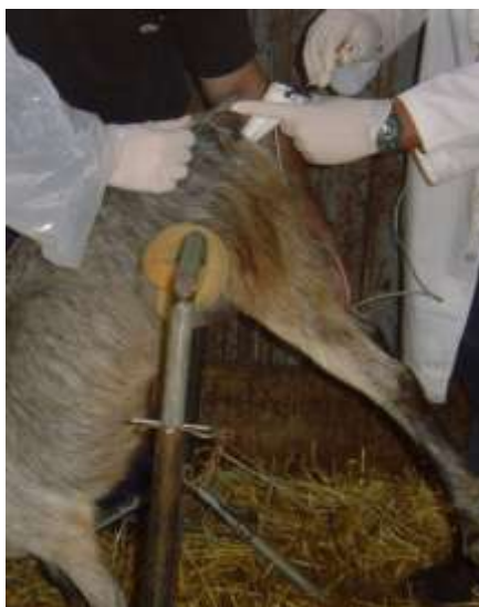
Figura 4. Inseminação artificial em cabra, com contenção em cavalete.