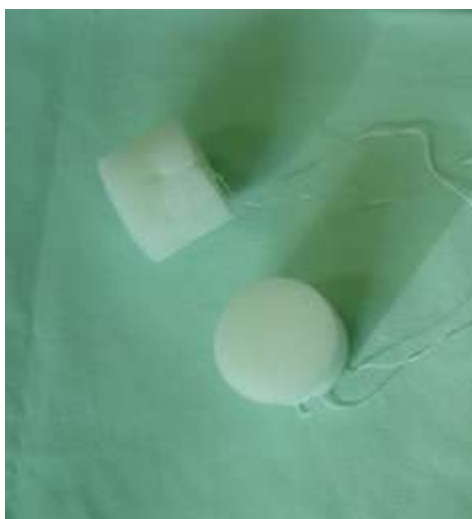
Fig. 2 Esponja impregnada com acetato de flurogestona (Chronogest®, Intervet) para cabras.