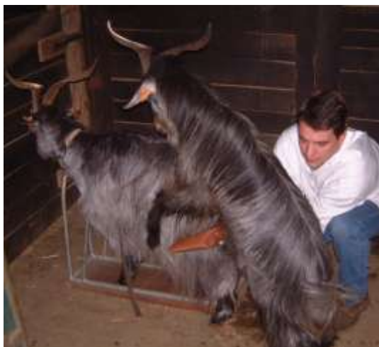
Figura 5. Colheita de sêmen de bode, com vagina artificial.